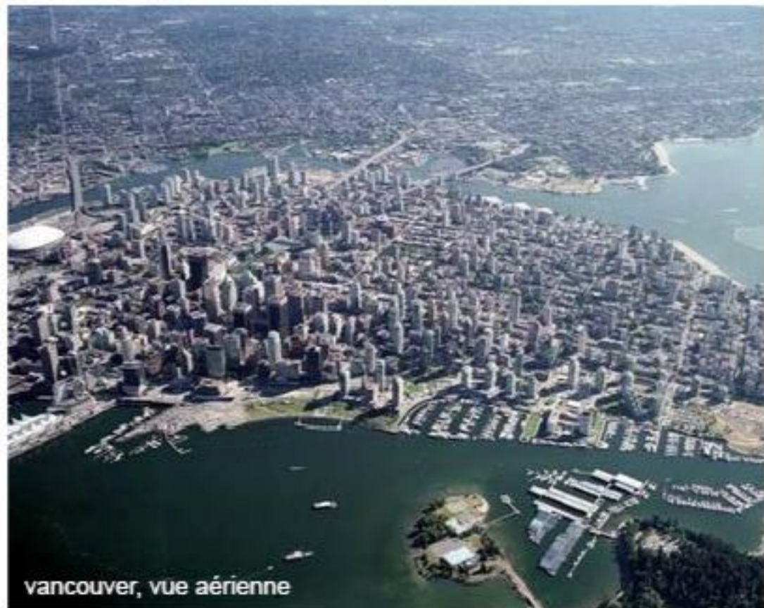
vancouver, vue aérienne

saison de théâtre, opéra et concerts de l'orchestre symphonique, et magasinage du temps des Fêtes. Il y a tant de choses à voir et à faire! Faites une minicroisière au son des chants de Noël, ou un séjour dans les hôtels les plus luxueux de Vancouver et profitez de tarifs d'automne fort intéressants.