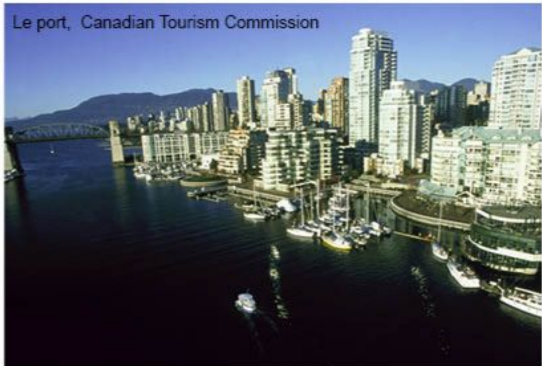
Le port

• Musée des beaux-arts de Vancouver - Situé au cœur du centre-ville de Vancouver, c'est la plus grande galerie d'art de l'ouest du Canada. On peut y admirer une gamme complète d'œuvres d'art nationales et internationales