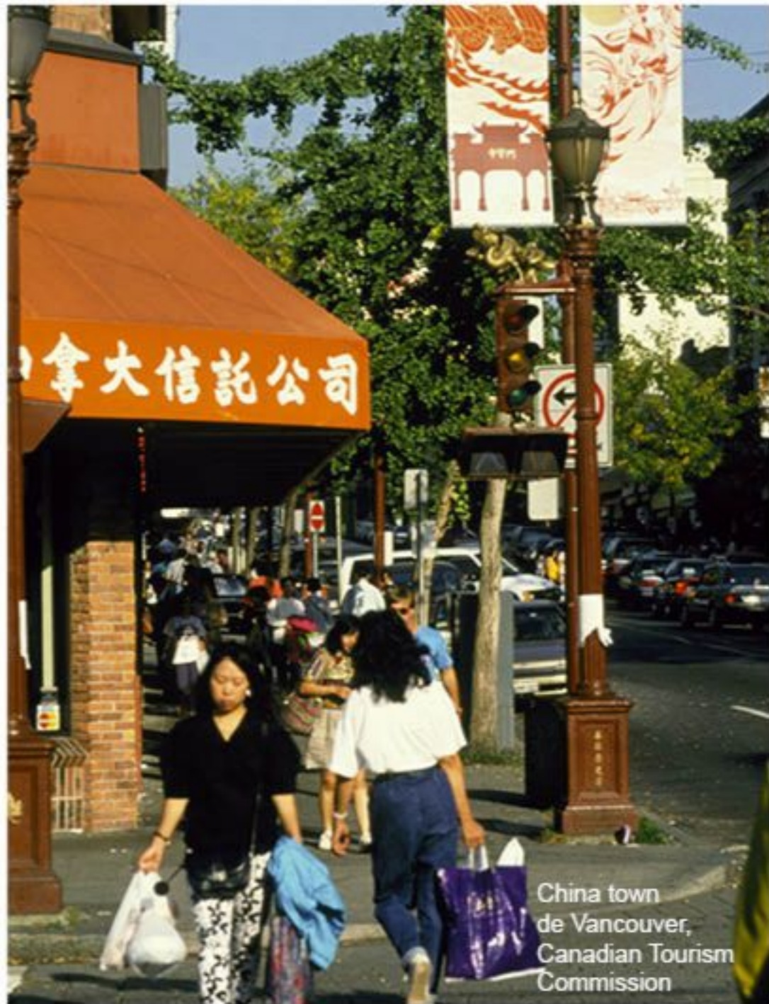
China town de Vancouver